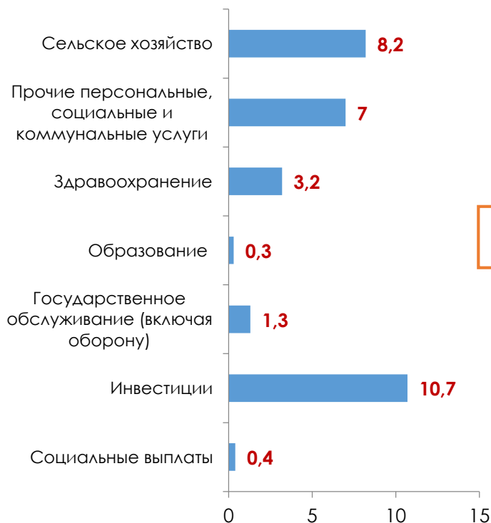
Сокращение номинального уровня расходов по основным статьям в 2017–2019 гг., %